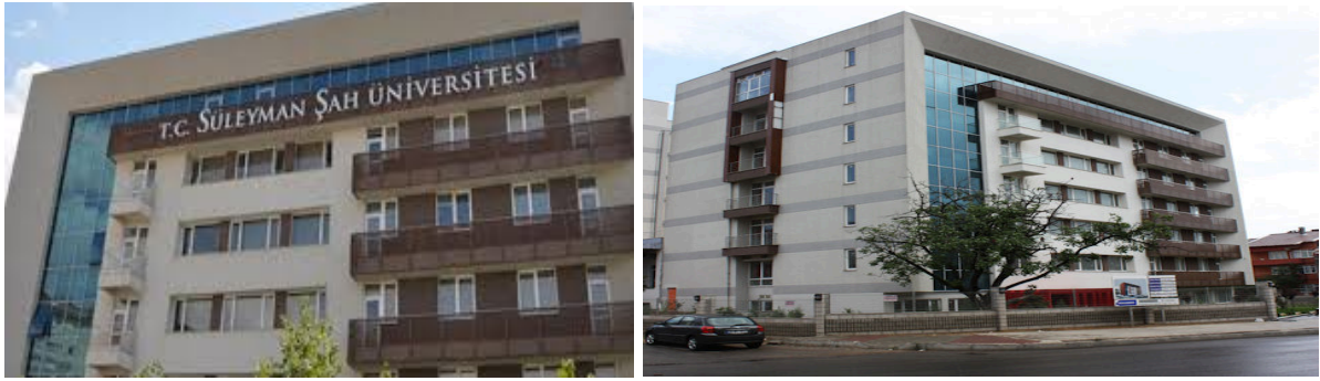
Resim 1. Süleyman Şah Üniversitesi Kartal Kampüsü

Üniversitenin ikinci ve ana kampüsü (Tuzla Kampüsü) 120.000 m 2 araziye sahipti ve Sabiha Gökçen Havaalanı'na sadece 3 km uzaklıktaydı. Tuzla Kampüsü 50.000 m 2 kapalı alana sahipti ve üç fakülte ve enstitü binalarında eğitim hizmeti veriyordu.